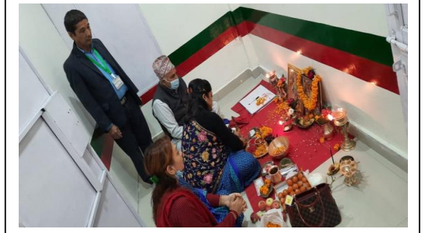
देवीनगर सेवा केन्द्रको शुभरम्भ कार्यक्रमको भलक ।