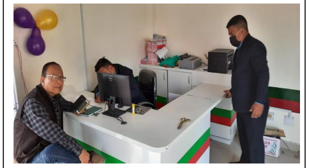
देवीनगर सेवा केन्द्रको शुभरम्भ कार्यक्रमको भलक ।