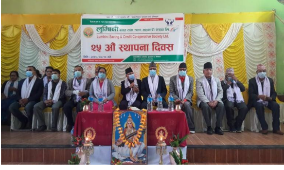
२५ औं स्थापना दिवसमा उद्घाटन कार्यक्रम ।