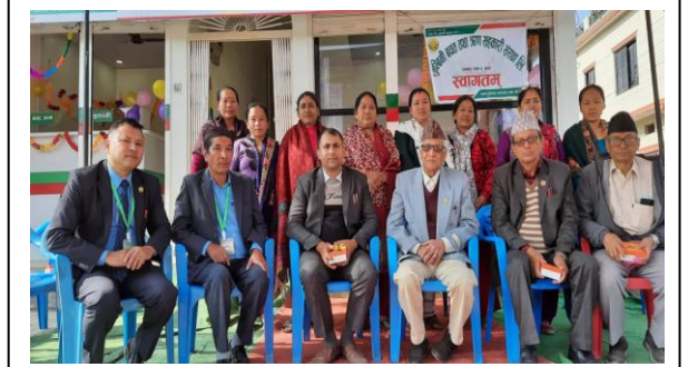
देवीनगर सेवा केन्द्रको शुभरम्भ कार्यक्रमको भलक ।