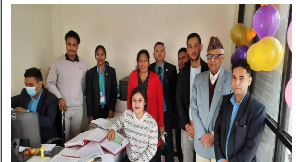
देवीनगर सेवा केन्द्रको शुभरम्भ कार्यक्रमको भलक ।