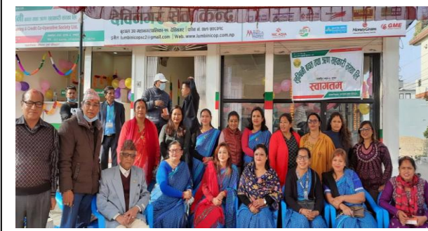
देवीनगर सेवा केन्द्रको शुभरम्भ कार्यक्रमको भलक ।