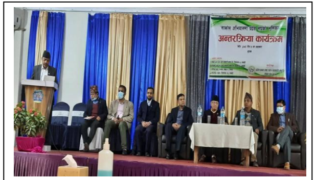
साकोस अभियानमा प्रदेश संघको भूमिका अन्तरक्रिया कार्यक्रम ।