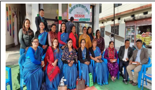
देवीनगर सेवा केन्द्रको शुभरम्भ कार्यक्रमको भलक ।