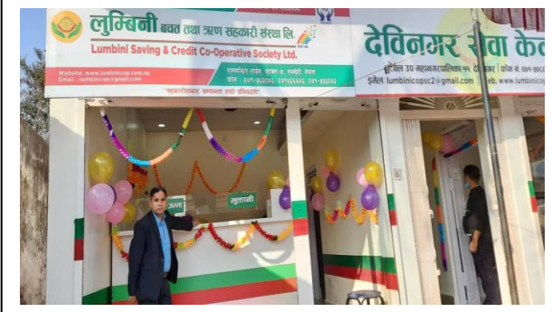
देवीनगर सेवा केन्द्रको शुभरम्भ कार्यक्रमको भलक ।