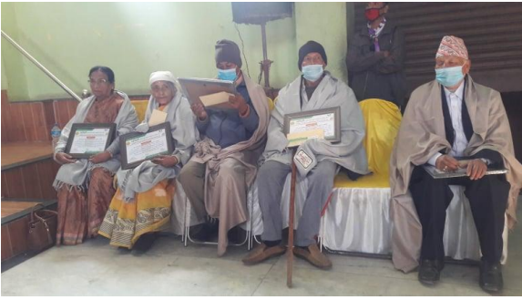
२५ औं स्थापना दिवसमा जेष्ठ नागरिक सदस्यज्यूहरुलाई सम्मान ।